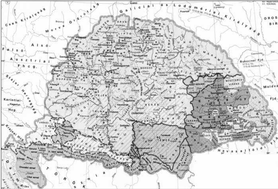
1. térkép. Magyarország a 18. század második felében

kötötte a fejedelmet és a rendeket, a 18. századra már a rendek és az abszolút uralkodó álltak szemben egymással. Ekkor az uralkodó már azzal az igénnyel lépett fel, hogy az ország jogát maga szabja meg; az ő nézőpontjából váltak a rendek kiváltságos testületté, és kizárólag csak rendekről beszéltek, nem pedig országról, tartományról. Ahogy Ludwig von Zinzendorf gróf az Államtanácsban 1765-ben kifejtette: „a rendeket privilegizált corps intermediaire -nek [köztes (hatalmi) testületnek] lehet tekinteni a fejedelem és az alattvalók között, de semmi esetre sem az ország urainak” 8 Magyarországon viszont még a 18. század végére sem sorvadt jelentéktelenné a rendek által birtokolt jogok szférája. Nem abszolút monarchia volt, ahol a király törvényeket hozhatott és adót vethetett ki, hanem rendi állam, amelyet rendi dualizmus jellemezett, ahol mindehhez a parlament, vagyis a rendi gyűlés hozzájárulására is szükség volt.